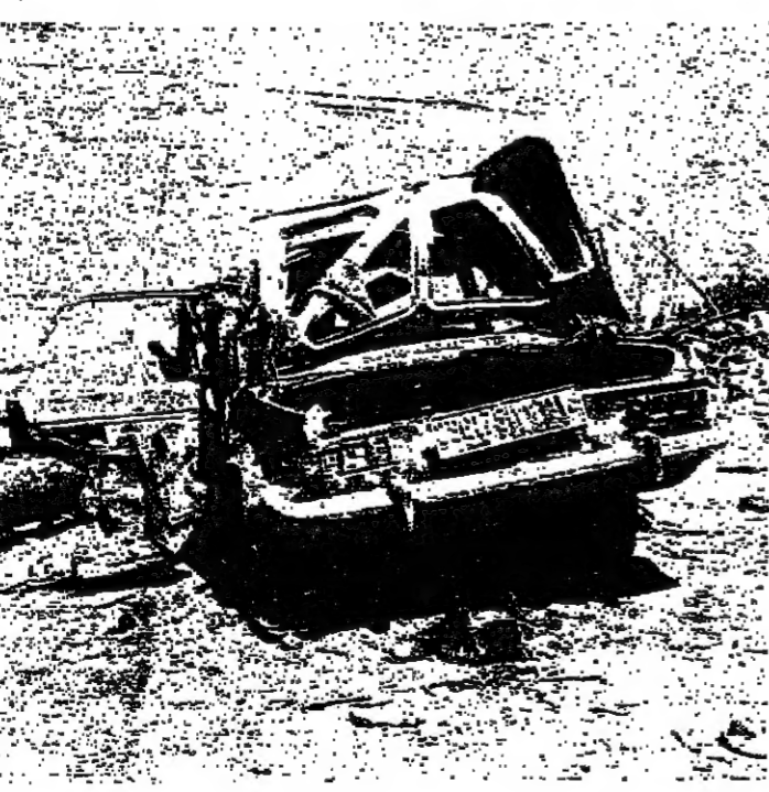
حتى السيارة لم تسلم من قذائف طائرات العدو